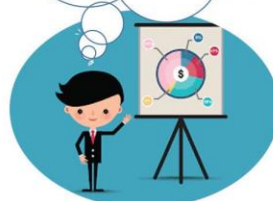
TỪ NGỮ CHỈ HOẠT ĐỘNG