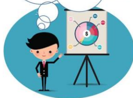
TỪ NGỮ CHỈ SỰ VẬT